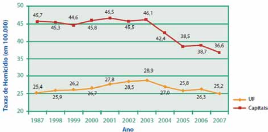
GRÁFICO 1 – Variação das taxas de homicídio em UF e capitais brasileiras entre 1987 e 2007.