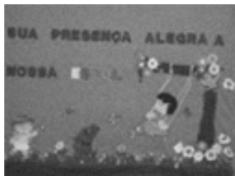
Figura 2: painel pátio da escola

Essas evidências de silenciamento e/ou “apagamento” do outro (CAVALLEIRO, 2005) mostram que na Escola Manuelita ainda faz-se necessário espaços-tempos que contemplem as marcas fenotípicas e/ou raciais, culturais, artísticas das múltiplas crianças e adultos que a compõem. A criação desses espaços-tempos que educam para as relações étnico-raciais mais igualitárias, como recomendado por Silva Jr.; Bento; Carvalho (2012), significa ter cuidado não só na escolha de livros, brinquedos, instrumentos, mas também cuidar dos aspectos estéticos, como a eleição dos materiais gráficos de comunicação e de decoração condizentes com a valorização da diversidade racial.