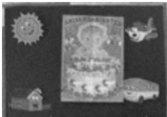
Figura 1: painel aniversariantes do mês.